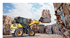
Recycling & Entsorgung