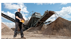
Brech- & Siebtechnik